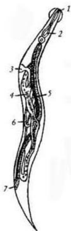
Самка острицы: 1 — рот; 2 — пищевод; 3—6 — части половой системы; 7 — анальное отверстие.