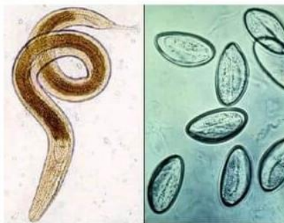
Острица: взрослая особь и яйца