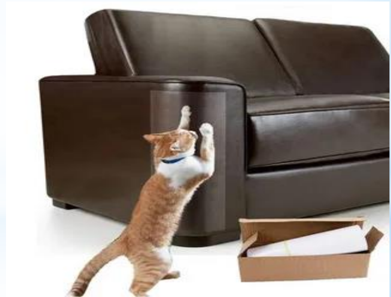
Скотч — годится для обучения котов не портить мебель