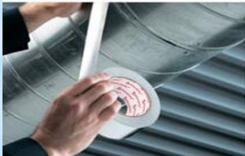
Замотать скотчем протечки в трубах